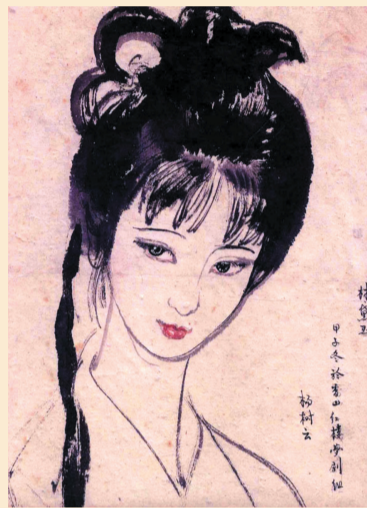
杨树云的林黛玉设计手稿