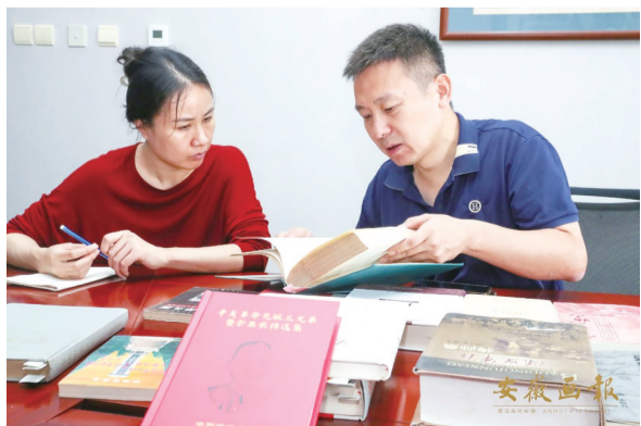
余亚农后人讲述他的传奇故事

1910年，余亚农秘密参加同盟会。1911年武昌起义前夕，余亚农受吴禄贞之命，去汉阳联系湖北新军起事。在汉阳，因起事日期尚未最后确定，余亚农返回安徽，进行联络。时值合肥光复，其次兄及孙品骞等人在合肥大同书院成立军政府庐州分府，前去襄助。后南京临时政府成立，余亚农被推选为全椒民军司令，复应聘为第1军训练处代理处长。