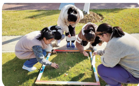
户外生物课,测量种群密度