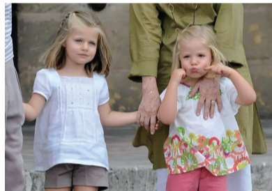
莱昂诺尔(左)和妹妹索菲亚