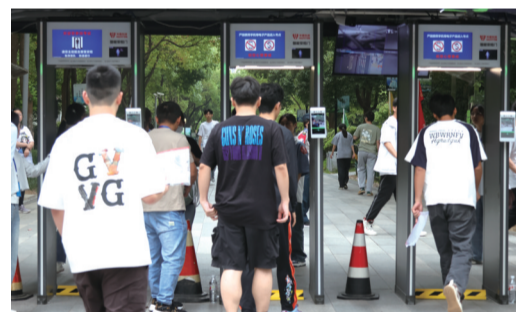
合肥八中考点考生通过安检门