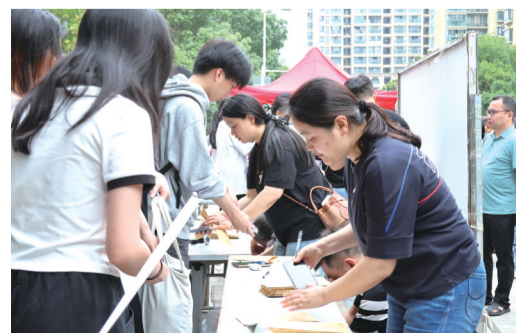
合肥八中考点外监考员正在把前来看考场同学的手机等电子产品封进考试专用手机袋内

西园街道还联合合肥交警蜀山大队三中队全力护航考点周边道路通行顺畅,同时对考点后门的丰收路进行临时封闭,禁止车辆通行,加强贵池路的巡逻管控和节点疏导。