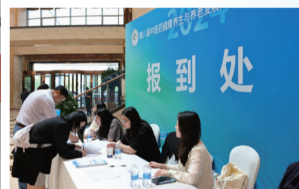
昨日,工作人员在为老博会的召开认真准备