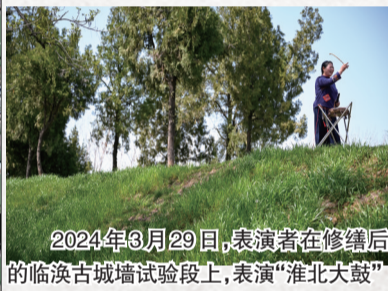
2024年3月29日，表演者在修缮后的临涣古城墙试验段上，表演“淮北大鼓”

鉴于临涣古城墙规模宏大，遗址现状留存区域广泛、面积广大，城墙局部区域建筑房屋占压严重、情况复杂等现状，同时为配合临涣镇的相关城镇发展规划，临涣城址城墙保护修缮工程分为两期执行，以确保文物保护工程与城镇建设协调发展。