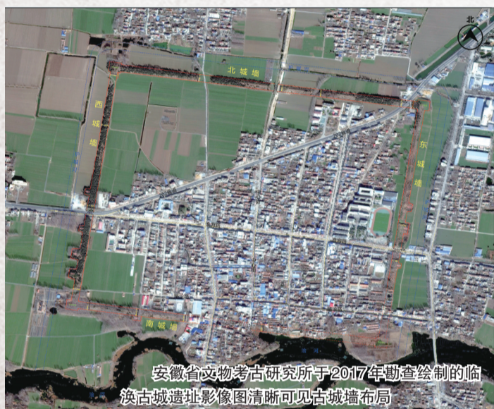
安徽省文物考古研究所于2017年勘查绘制的临涣古城遗址影像图清晰可见古城墙布局

如果不是眼前石标上“临涣城址城墙界”几个大字，人们难以想象一马平川的皖北平原上，凸起一段周长达6公里，高度两三米的夯土城墙。历经千余年风雨洗礼，如今的古城墙外表被绿植覆盖、树木环绕，光荣与威慑虽已不复当年，但更可近可亲。当地居民及游客沿着城墙上的廊道漫步，俯瞰古镇风光，与现代生活相融共生，古城墙也从冰冷的遗迹变成“活着”的历史。 记者 王玮伟 黄洋洋/文