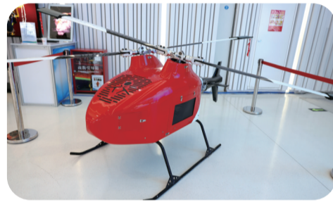
内蒙古工业大学交叉双旋翼无人直升机