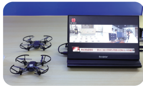
西北工业大学展示意念控制无人机编队