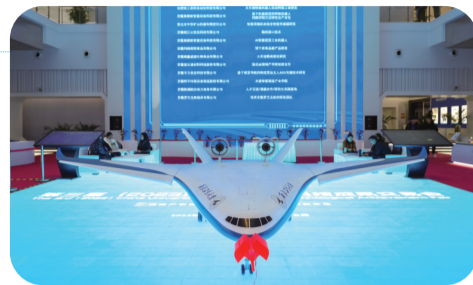
西北工业大学的无人机展示

大会期间,市民无需线上预约即可前往安徽创新馆1号馆、3号馆观展,开闭馆时间为:9:00-17:30。