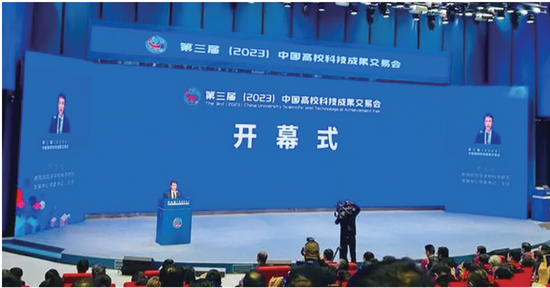
第三届(2023)中国高校科技成果交易会开幕式现场

星报讯(记者 章沁园 周诚 文/图) 12月18日上午9点,由教育部、安徽省人民政府共同指导,教育部高等学校科学研究发展中心牵头,长三角一市三省教育厅(委员会)、安徽省经济和信息化厅、合肥市人民政府等联合主办的第三届(2023)中国高校科技成果交易会(下称“科交会”)在安徽省合肥市安徽创新馆举办开幕式,本届大会时间持续至12月20日,主题为“促进产学研深度融合 携手创新共赢发展”。