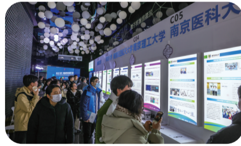
现场观众参观高校成果展示