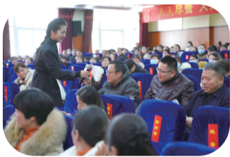
语文名师成长工作坊阶段性成果展示活动