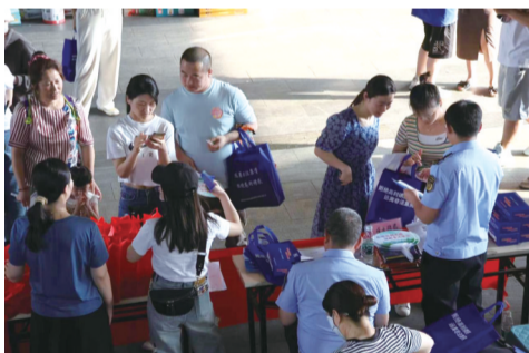
合肥市包河区防范非法集资宣传月活动

三是把握节奏有序推动。明确6月1日~30日开展宣传月,指导各地各部门做好组织引领、部署推动和督促落实,持续厚植全民防非、主动拒非的社会氛围;6月12日~21日,指导各市各单位广泛动员、深入发动、积极参与第三届全国防非知识答题赛;15日集中宣传日当天,指导各地各部门出硬招、实招、亮招“集中发声”“集体行动”,掀起了全省防非宣传“高潮”。