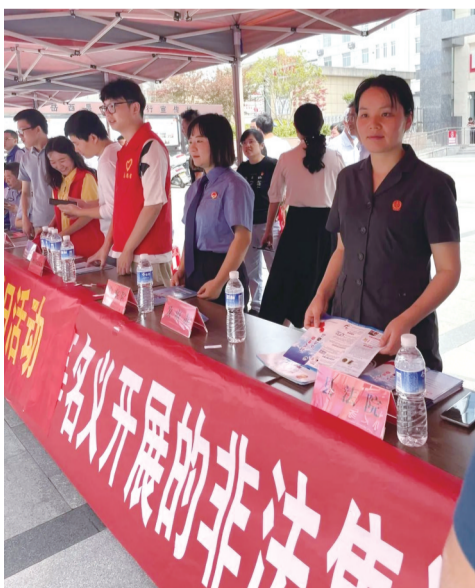
安庆市防范非法集资宣传月活动