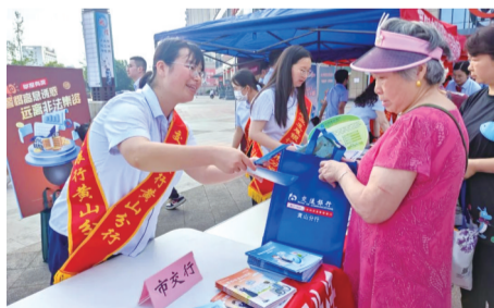
黄山市防范非法集资宣传月活动