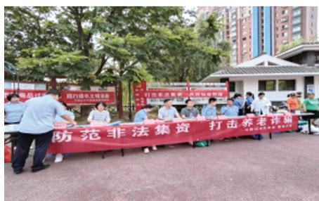
马鞍山市防范非法集资宣传月活动