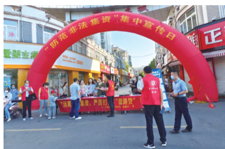
六安市防范非法集资宣传月活动