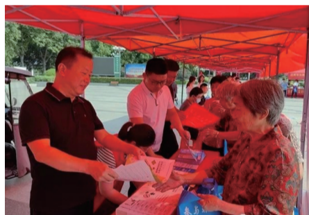
阜阳市防范非法集资宣传月活动

一是创新宣传主体,变“干部讲”为“大家讲”。省处非办按照“专群结合”思路,探索建立全省“干部+群众”防非队伍,多元打造宣传“带头人”,推动专家干部讲理论、领导学者讲政策、典型人物讲经验、基层群众讲体会,真正变“个人讲”为“大家讲”、变“少数人讲”为“多数人讲”、变“干部讲”为“一起讲”。其中,省处非办全体成员及群众代表共同拍摄的“守住钱袋子·护好幸福家”宣传片备受干群好评。