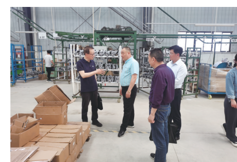
蚌埠市商务和外事局在企业普法顾问全程参与行政决策的全过程;加强学习宣传,通过线上线下考试学习培训,强化业务和法律知识学习。”

蚌埠市商务和外事局坚持完善依法行政制度体系,出台重大行政决策及行政规范性文件制定程序,细化合法性审核、公平竞争审查等工作流程。严格落实普法责任制,建立普法责任清单,深入开展法律法规集中宣传。积极推进政务公开,在局网站设立局长信箱,公布监督电话,公开办事流程,接受群众监督。坚持深化商务领域信用体系建设,制定年度社会信用体系建设工作要点,明确目标任务、方法路径、责任分工,强化工作推进。