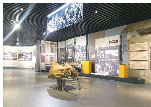
小李家纪念馆展出的“今日小李家”