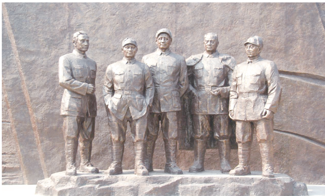
小李家纪念馆雕塑

淮海战役总前委旧址小李家位于濉溪县韩村镇淮海村小李家。在这里，有一处不起眼的石基土墙茅草屋，它曾经是淮海战场人民解放军的神经中枢，也是几十万大军的统帅部。今天就让我们一起了解“运筹小李家，决胜大淮海”背后的故事。