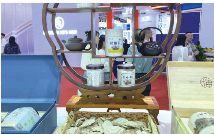
皖企展示的传统地道生态徽乡食品

记者了解到，本届消博会安徽馆分为三个篇章，第一篇“创新篇”，展示蔚来新能源汽车、荣电等企业的智能电器、家居设备、健康家电等消费精品；第二篇“传承篇”，与观展嘉宾共品“安徽茶业”淡雅徽茶，喝“古井贡”“口子窖”“金种子”等醉美皖酒，赞非遗传承徽雕技艺、铜艺文化；第三篇“生活篇”，共尝含山大米、繁昌葛粉、亳州石斛、铜陵白姜等传统健康食品，试乘风破浪新宠、挑舒悦家居。值得一提的是，本次参展的17家企业中，有5家乡村振兴主题企业，主要展品包括茶叶、大米、白姜、葛根粉、袜类等，借助消博会平台，帮助企业开拓国际国内消费品市场。