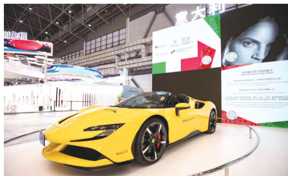
主宾国意大利展区一角

此外，意大利作为本届消博会主宾国，参展品牌达147个，展览面积约1800平方米，均比上届增长1倍左右。