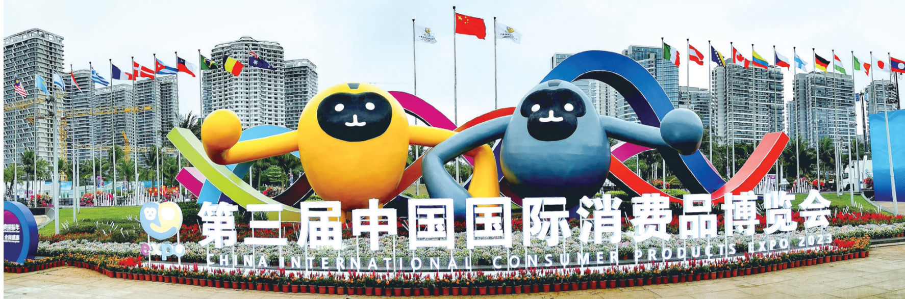
第三届消博会主入口的立体花坛雕塑