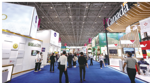
观众在消博会现场参观