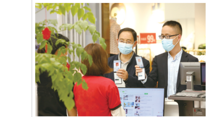
加强日常监管护航商务发展—单用途预付卡检查(组图) 黄俊军 黄山市商务局