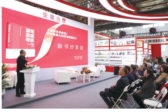
2月24日,安徽人民出版社在京举办《谱写发展奇迹:新中国重大经济成就精讲》新书分享会。中宣部原副秘书长、出