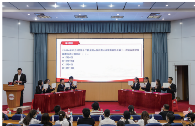
学宪法 讲宪法 宪法驻心中 合肥工业大学 陈家涛 李瑞琪/摄