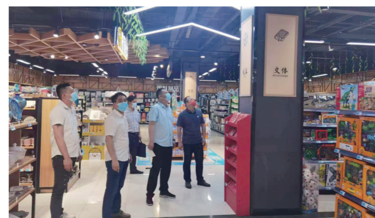
超市文明创建检查

此外，还有多项工作——整理作品台账，将更新的视频发放到各地市群、配合主办方制定相关活动实施方案、评分方案，大赛现场展示播放作品等工作。在评审现场，公司导演、摄像全部上阵，协助做好专家评分统计、大赛活动现场视频和照片摄制、视听设备调试等工作。