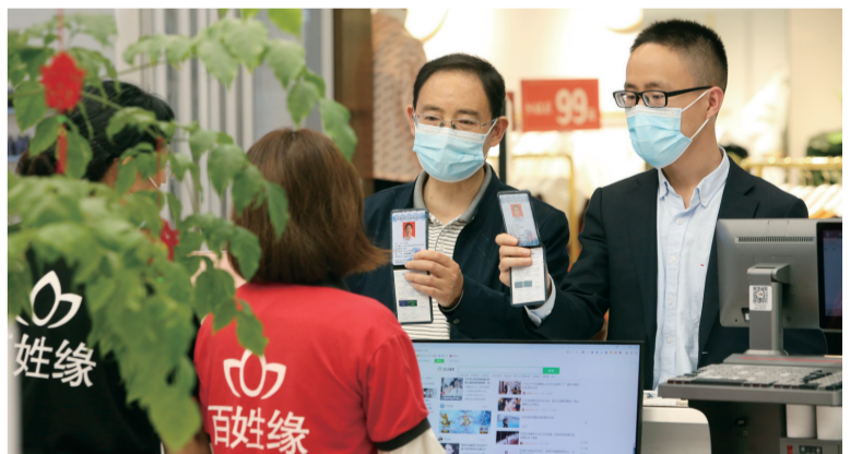
单用途预付卡检查 黄山市

近年来，安徽省商务厅高度重视法治化营商环境建设工作，围绕省委、省政府关于深化“放管服”改革和优化营商环境决策部署，真心实意为民办实事、为企业优环境，提前谋划、统筹安排，厅领导多次到一线进行指导和调研，及时协调解决政务服务改革过程中遇到的困难和问题，全面实施“互联网+政务服务”改革，取得了显著成效。