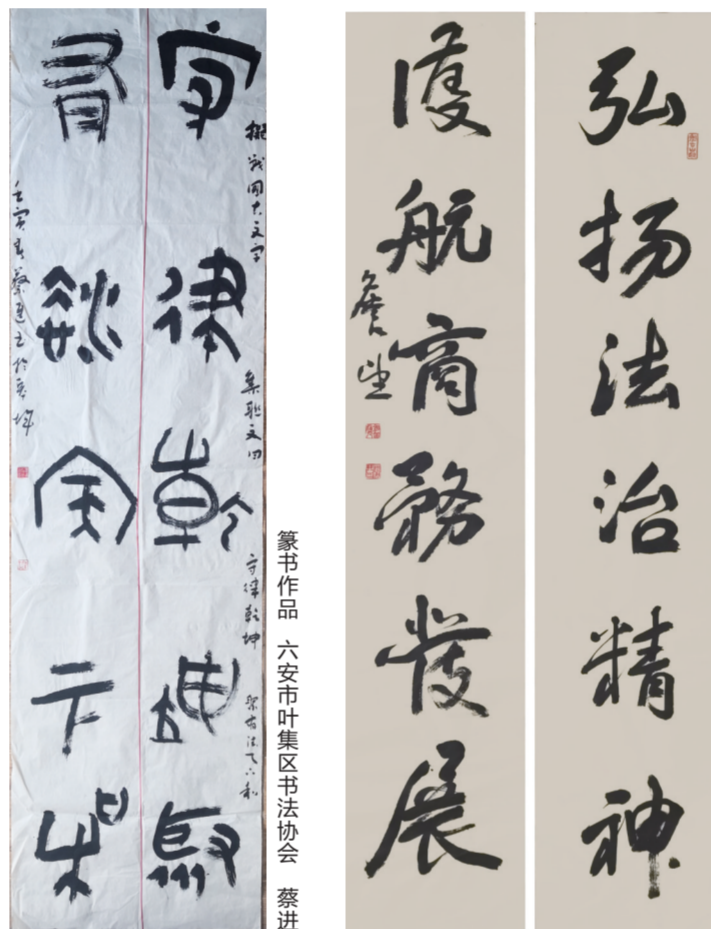
书法作品 六安市市叶集区书协协会 蔡建