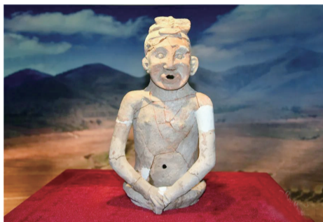
兴隆沟遗址出土的敖汉陶人。

除了红山文化，山东的大汶口文化、江浙地区的良渚文化等也都与中原文化相互交汇，“你中有我，我中有你”，东西南北文化在相互交融中共同跨入文明社会。