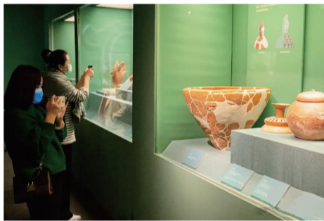
国家博物馆“红山文化考古成就展”。