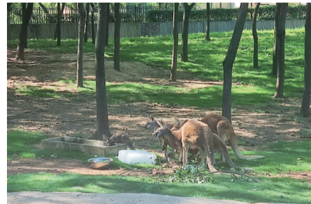
袋鼠在冰块旁享用美食