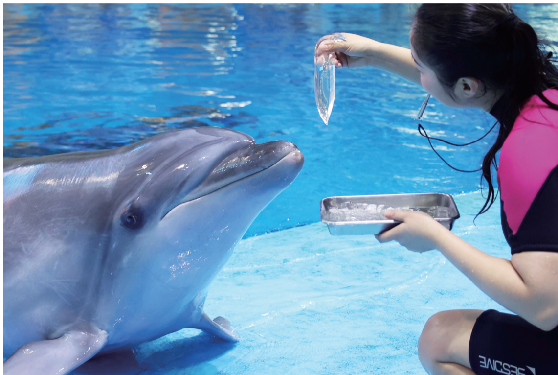
海豚食用青鱼“果冻”