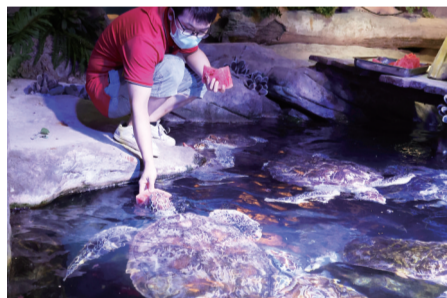
合肥海洋世界工作人员为海龟喂食西瓜