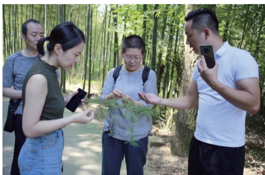
研发团队在选取加入浆料的植物