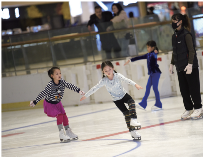
2021年12月15日,女孩在冰纷万象滑冰场学习花样滑冰