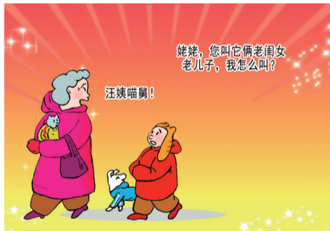
一家亲 ■ 祁雪峰/画