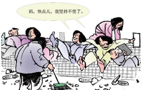
饭后 ■ 马群海