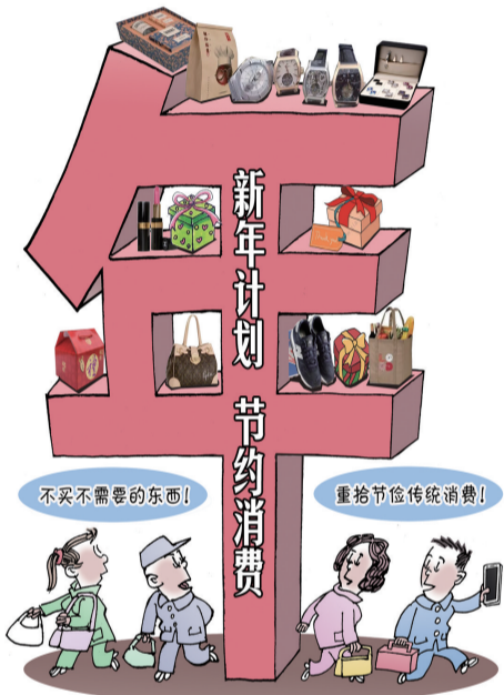
不买年 ■ 蒋跃新