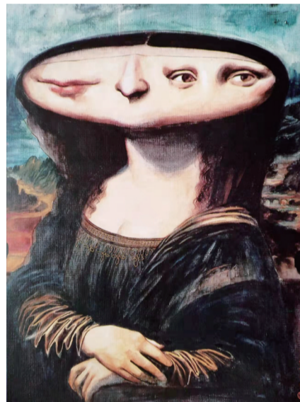
摆平——凭什么你在我上面 ■ 詹同

詹同(1932年-1995年10月27日):曾任中国动画协会副会长,中国美协漫画艺委会委员,上海美术电影制片厂一级美术设计兼导演。被称为上海美影厂“三剑客”之一的中坚人物。他的画除了构思奇巧外,造型和线条功夫也都让人百看不厌。他的《摆平》《百鬼斩尽、独留此精》等作品都成为中国漫画的经典作品。