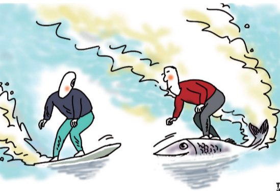
冲浪 ■ 罗琪