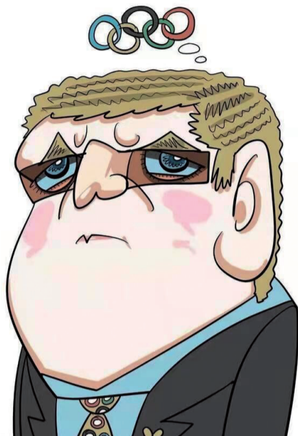
国际奥委会主席托马斯·巴赫 ■ 李坤