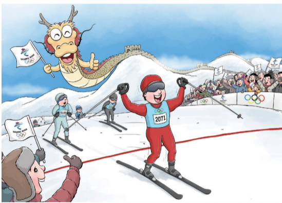
齐声喝彩 ■ 郝延鹏