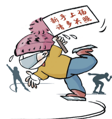
初学 ■ 王永琦