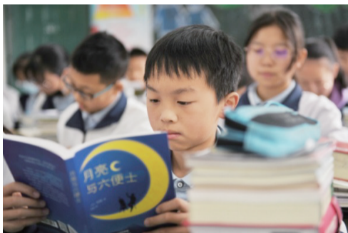
凉山州民族中学学生正在翻阅获赠图书。