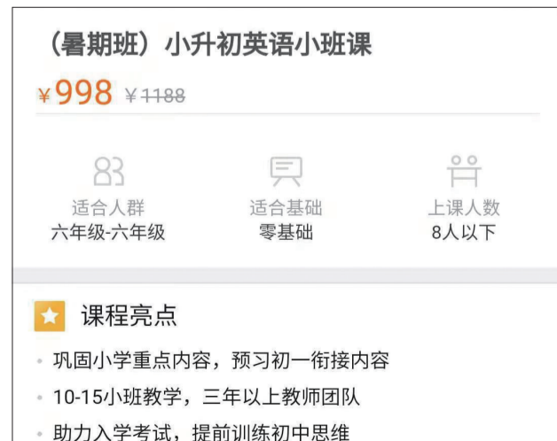
在宣传广告中,爱问教育标注“小学知识巩固,初中大纲预习”