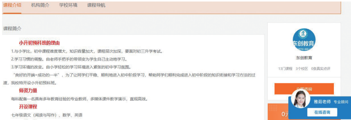
东创教育小升初预科班介绍

记者了解到,实际上,从2020年11月1日至2021年4月30日,合肥市教育局就开展了专项整治,净化合肥市教育培训市场。其中,就明文规定:严禁开展“幼小衔接”“小升初”“初升高”或“非零起点”培训。