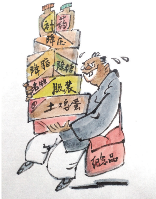
捡来的病 ■ 王恒/漫画

老张退休后闲来无事，爱上了捡各种各样的小便宜，从打折促销的各式商品到参加活动领回来的纪念品，家里堆满了各种各样的东西。