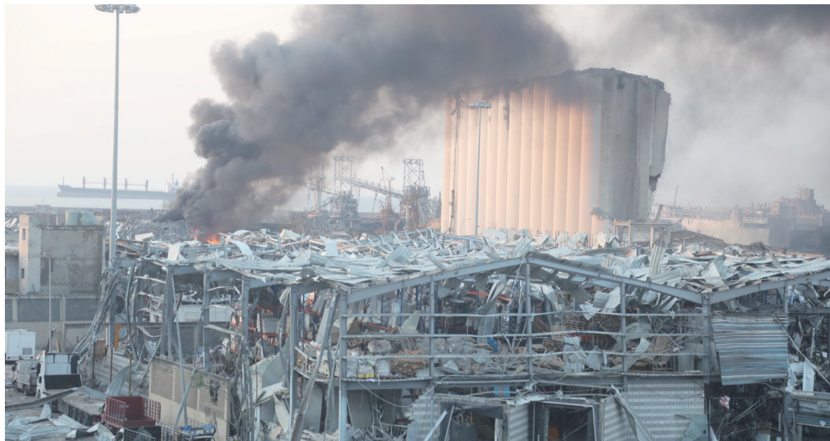
爆炸现场浓烟滚滚

爆炸发生后,贝鲁特连续发生大规模示威活动,抗议发生大爆炸以及当局腐败等。8月10日,黎巴嫩时任总理哈桑·迪亚卜宣布政府集体辞职。10月22日,总统奥恩任命前总理萨阿德·哈里里为新一任政府总理,并授权其组阁。