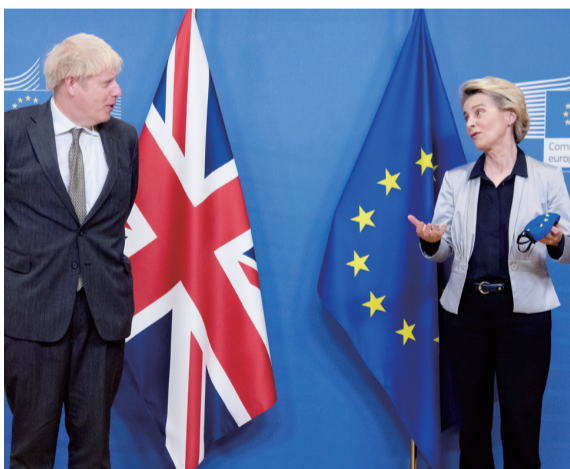
英国首相约翰逊(左)与欧盟主席冯德莱恩会晤