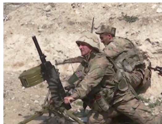
阿亚冲突现场,士兵手持武器

英国脱欧谈判特别困难,因为这是欧盟历史上首次双方都希望摆脱现行规则。许多人调侃:脱欧成了“拖”欧。就在大家对“脱欧”谈判陷入绝望时,英国和欧盟24日宣布结束关于双方未来关系的谈判,就包括贸易在内的一系列合作细节达成一致。这意味着从2016年“脱欧”公投后笼罩英国多年的“无协议脱欧”阴霾终于散去。