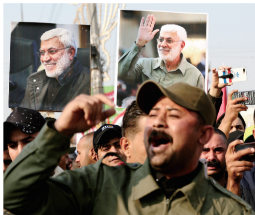
人们参加苏莱曼尼的葬礼

2020年美国大选全球瞩目,共和、民主两党竞选中相互指责对方一旦胜选将给国家带来灾难。大选前大部分人都认为特朗普会连任。然而选举投票开始后,拜登先后拿下摇摆州威斯康星州、密歇根州。之后,又赢得宾夕法尼亚和内华达州,锁定胜局。12月14日,美国各地选举人进行投票,拜登被选举为下一任总统。不过,特朗普宣称此次选举存在大规模舞弊行为,迄今不承认自己败选。