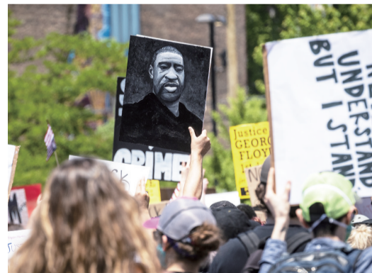
示威者手举弗洛伊德画像参加游行