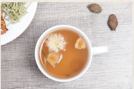
被虫咬可用蒲公英煎汤冷敷

若症状显著,可以用蒲公英、地丁草、野菊花、金银花、大青叶、生地榆等煎汤冷敷。此外,可以外抹炉甘石洗剂。病情严重时应及时去医院就诊。