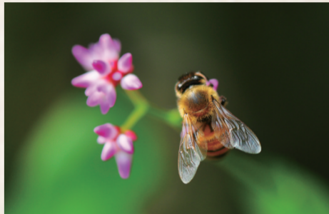
被蜜蜂蜇不能大意

一旦被蜜蜂蜇伤,要仔细检查皮肤有无折断的毒刺,如有毒刺可用镊子拔出,然后用拔火罐或吸奶器吸出毒液,切勿用手挤压,以免更多的毒液挤入皮内引起严重过敏反应。患者除了皮肤的红肿,还可能出现恶心、呕吐、全身性水肿,甚至是呼