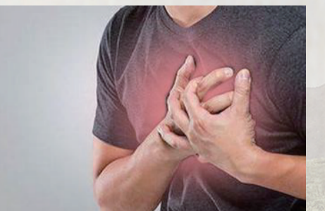
蜈蚣咬伤致心脏麻痹

一旦发现被蜈蚣咬伤后,可以立即用肥皂水冲洗,中和其毒液的酸性。然后涂上较浓的碱水或3%的氨水。如果常规处理后仍然肿痛难