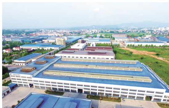
奥特佳机电有限公司的成片厂房