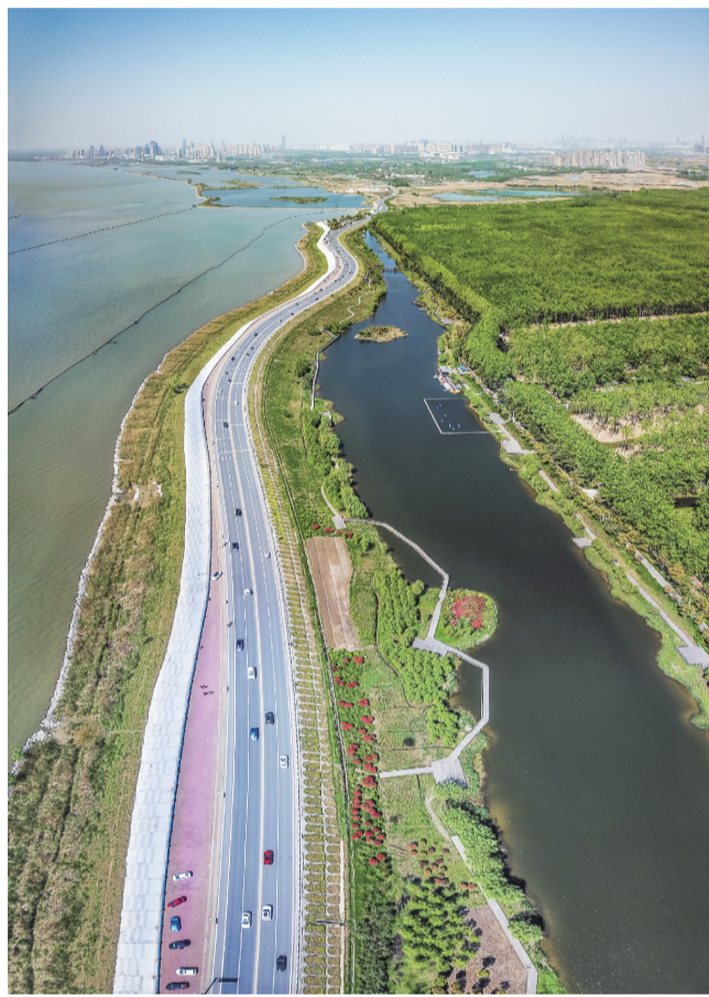
环湖大道

2018年1月1日起，《安徽省地表水断面生态补偿暂行办法》实施。我省建立了“以市级横向补偿为主、省级纵向补偿为辅”的地表水断面生态补偿机制，超标断面责任市支付污染治理赔偿金，水质改善断面责任市获得生态补偿金。全省共有121个断面纳入补偿范围，涵盖境内的淮河、长江、新安江干流及重要支流、重要湖泊。截至2019年底，全省累计产生污染治理赔偿金2.47亿元，生态补偿金5.33亿元。