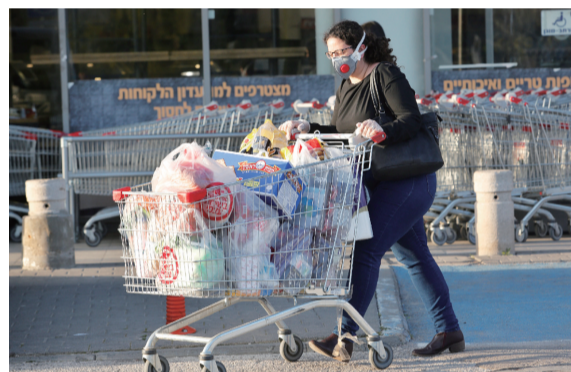
3月25日在以色列中部城市莫迪因一家超市外拍摄的佩戴口罩的民众。