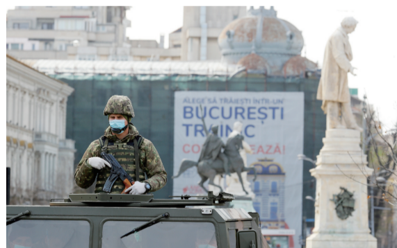
罗马尼亚3月25日起实行全天戒严措施,居民不得随意外出,65岁以上老人一律不得走出家门。军队将协助警察执勤。 □ 新华社发