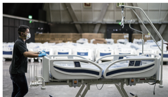
3月24日,在智利首都圣地亚哥,工人在列斯科会议中心改造成的临时医院安置病床。