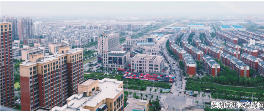
芜湖经开区鸟瞰图

年轻的开发区缘何能取得一系列的成就？宁国经济技术开发区的相关负责人坦言，一个地区营商环境的优劣直接影响着招商引资的多寡，同时也直接影响着区域内的经营企业，最终对经济发展状况、财税收入、社会就业情况等产生重要影响，而宁国经开区在优化营商环境上，就下足了功夫。