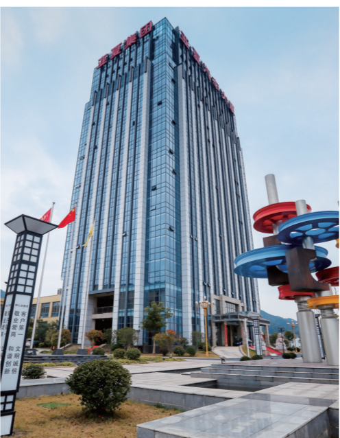
宁国经开区亚夏集团