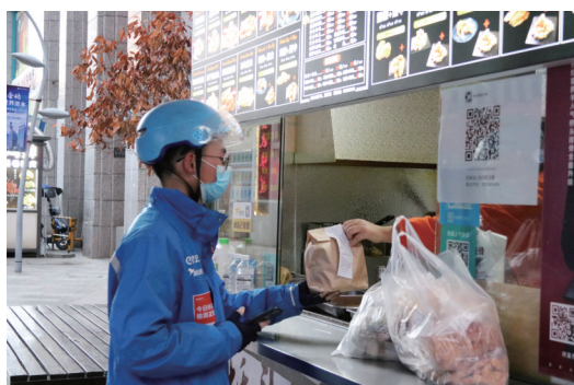
疫情期间，送餐基本是放在小区的固定地点