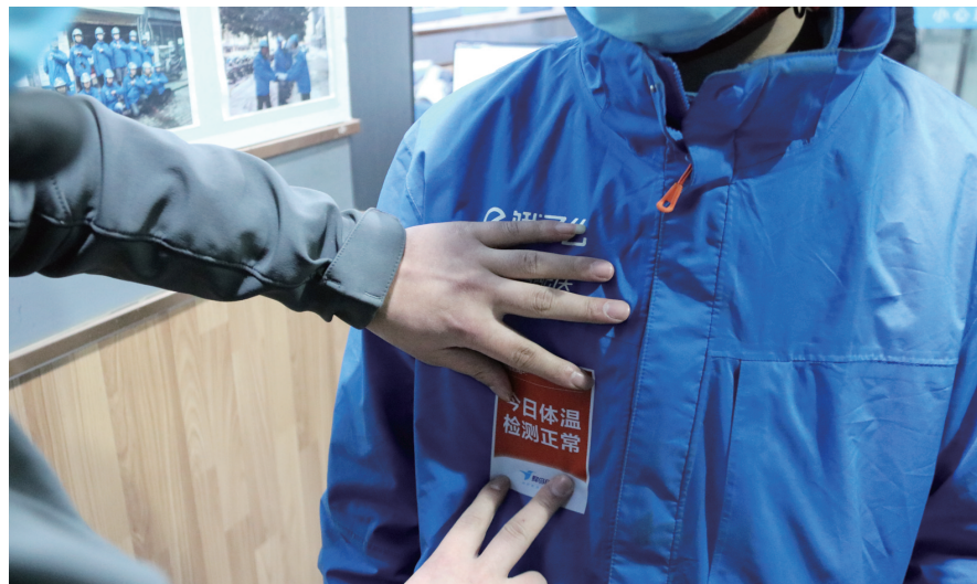
体温正常的骑手会被发放安心贴