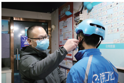
测量体温成了疫情期间的日常必备流程