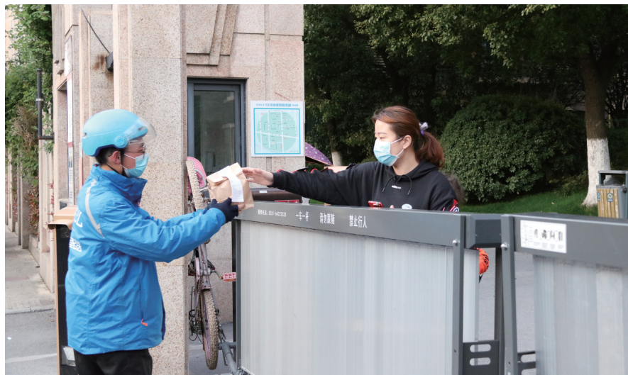
外卖员成为连接小区与外界的桥梁