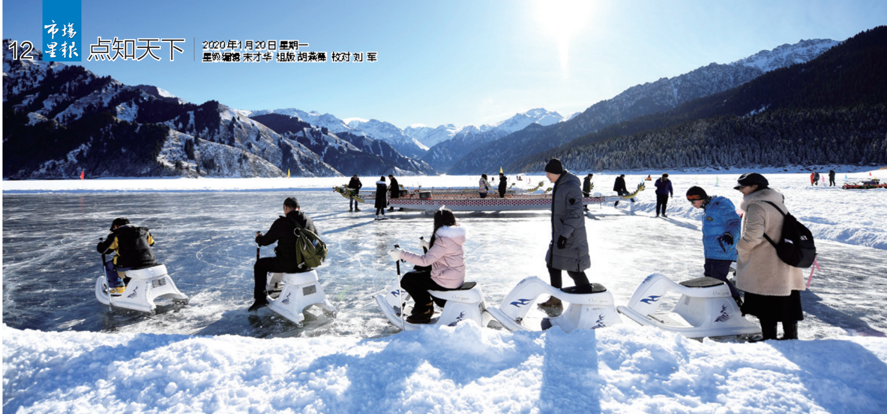
美图 新疆天池 冰封雪湖

1月18日,游客在新疆天池景区玩冰上爬犁。当日,2020年天山天池“冰封雪湖”冰上项目在新疆天池景区开幕,景区推出丰富多彩的冰上项目,游客在尽情运动的同时还可充分体验冬季天山天池的美景。□ 新华社发