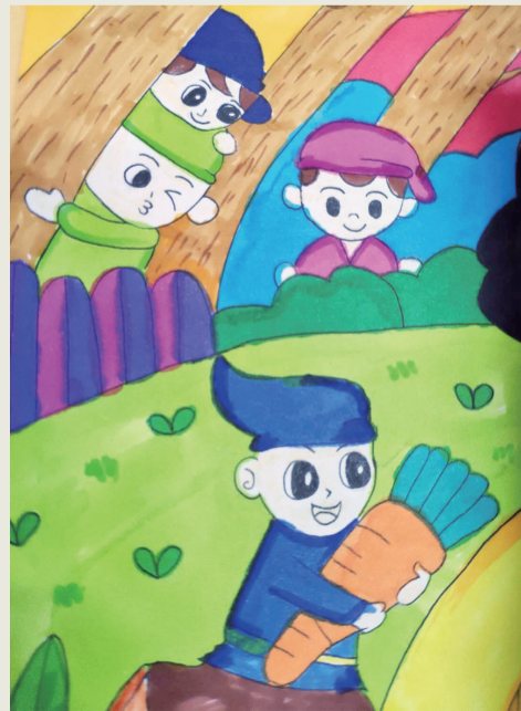
《童心看神话》二(4)班 李天娇 指导老师 陈玉

今天的中国,科学飞速发展,女媧造人、女媧补天、八仙过海、嫦娥奔月,都不仅仅是神话故事,科学家们将一步步实现……让我们好好学习科学知识吧!长大了,努力把小时候的童话、神话故事变成现实,为中国这条巨龙插上腾飞的翅膀!