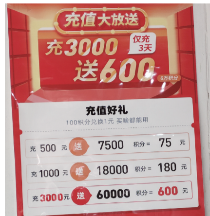
墙壁上张贴的充3000元送600元的宣传单

近日，有市民反映，位于合肥华邦繁华里小区的呆萝卜店，此前称闭店升级，重开才个月，突然关停，不少会员充值几百上千，不知道该怎么办。记者随即探访得知，小区店铺由于顾客少，只能关停，不过会员可选择前往其他呆萝卜店消费，也可选择退款；对于充值送款，将按比例进行扣除。