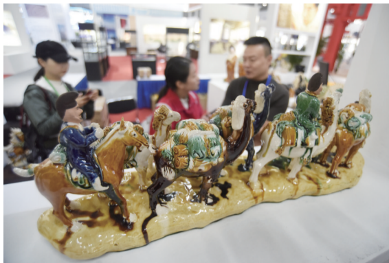
展馆内的文创产品

据介绍，这次文博会在主展馆专门设立了博物馆文化创意产品展，设置国家一级博物馆展区、新中国70周年历史文化博物馆联展展区、长三角博物馆联展展区、特色文