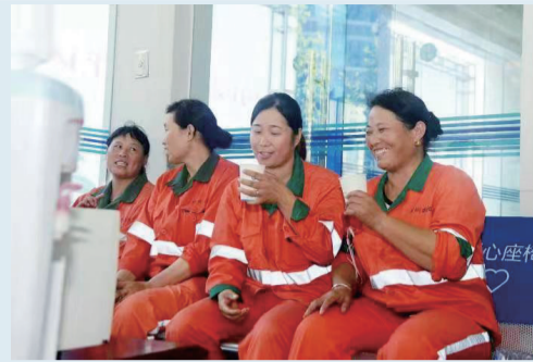
446家“劳动者港湾”传递温暖关怀