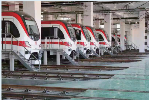
为合肥轨道交通提供金融服务