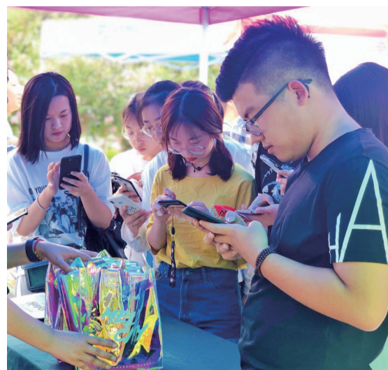
学子正在扫码领礼包