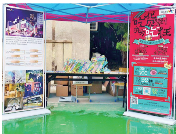
开学季，礼物给大家准备好了

大学是每个学子心目中的“象牙塔”，也是人生中最美的站点。青春的岁月，在这里可以学到专业知识，交到知心朋友，找到发展方向，确定未来目标，完成了梦想到现实的过渡。