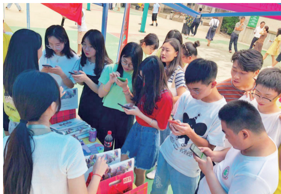
学生们纷纷拿出手机注册