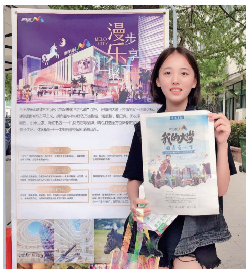
学生与《我的大学》合影