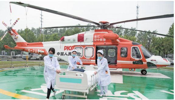
安医大一附院配备的医疗救援直升机

创立，校址在南市沪军营外马路363号，另租借薛家浜陈宅为校外宿舍，并设附属医院（又称东南医院）。实行校院合一，众推褚民谊为首席校董，郭琦元为校长。9月10日，东南医科大学开学，首期招收医学专科4级学生170人，缪征中任教务长，汤鑫舟任医务长兼医院院长。