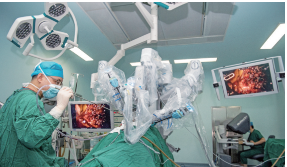
国际最先进的达芬奇手术机器人