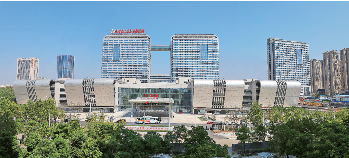
安徽医科大学第一附属医院高新院区