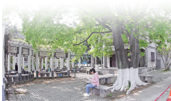
有200多年树龄的朴树和后面的“所松阁”小楼，仍在延续昔日的辉煌

凤凰涅槃，浴火新生。正是有了当时的内迁决定，才会有在安徽大地播撒希望的种子，才有了今天生机勃勃、展翅翱翔的安医！ □周卫星/文