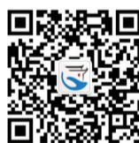
掌中安徽 微信二维码