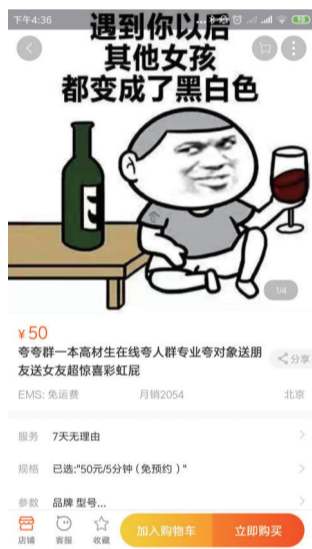
一本高材生夸夸群店铺中不乏月销过千的