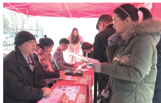
昨日，“春风行动，接您回家”专场招聘会走进合肥市西园街道汉嘉社区，80多家企业提供了会计、检验员、维修工、文员等3000多个涉及53个工种就业岗位。 □卜利 安梅 雨静 记者 马冰璐