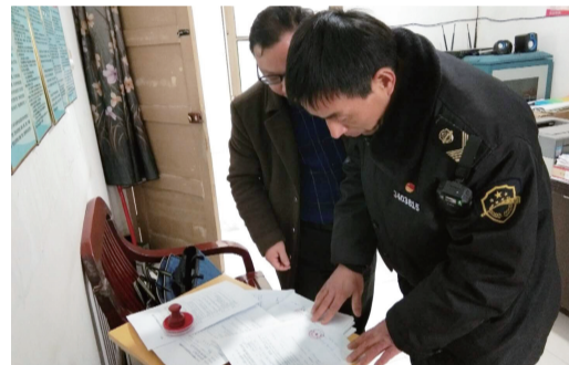
为切实抓好学校(含托幼机构)食堂食品安全工作，巢湖市食药监局局岗所近日联合乡食安办，对辖区内中小学、幼儿园食堂开展食品安全专项检查。 □张庆亚