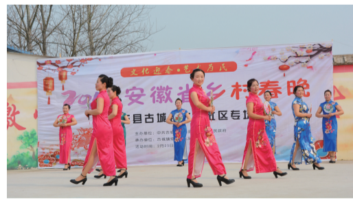
近日，首届以“文化迎春，艺术为民”为主题的大型春晚在肥东县古城镇古城社区文化广场盛大登场。此次春晚是由古城镇党委政府主办，古城镇综合文化站、古城社区承办。 □高楨 记者 赵汗青