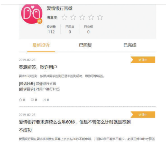
黑猫投诉平台上，有关爱情银行的投诉已达112件