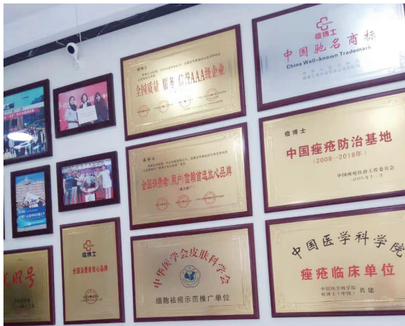
痘博士满墙的牌匾

而在另一面墙上,痘博士痤疮医学研究院的广告上写着,“我们有百家直营门店,遍布28个省58座城市,诺贝尔品牌专业祛痘。”