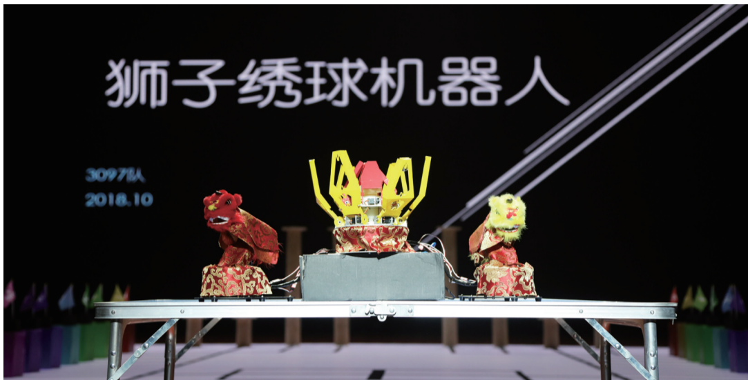
机器人表演狮子舞绣球