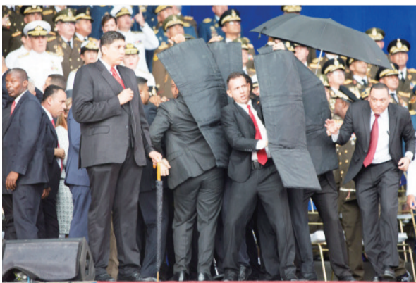
安保人员保护总统

委内瑞拉新闻部长罗德里格斯4日确认，当天发生针对委内瑞拉总统马杜罗的无人机袭击事件，马杜罗目前安然无恙。当天下午，委内瑞拉国民警卫队在首都加拉加斯的玻利瓦尔大道举行成立81周年庆祝活动，委国家电视台对活动进行了现场直播。马杜罗在活动中发表讲话，随后现场传出疑似爆炸声，并响起警报。