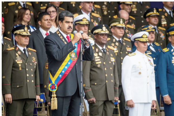
委总统马杜罗(左二)出席庆祝活动