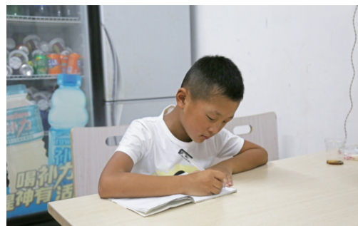
孩子平时就在店里学习