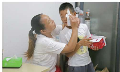
妈妈给刚回来的孩子擦汗