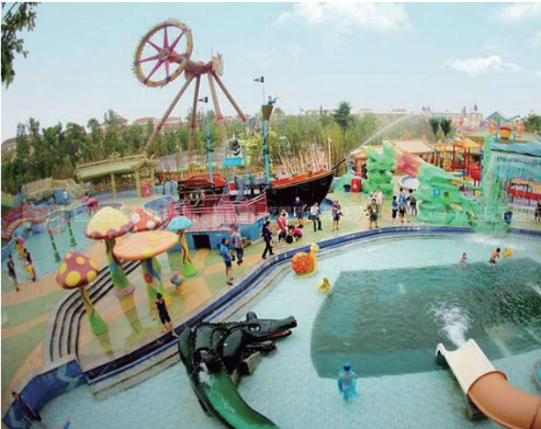
芜湖方特水上乐园

安徽名山荟萃，秀水竞流，每个角落、每处风景都有独特的色彩。来安徽避暑，饱览万种风情，一定会使你满载而归，留下快乐、美好的回忆。