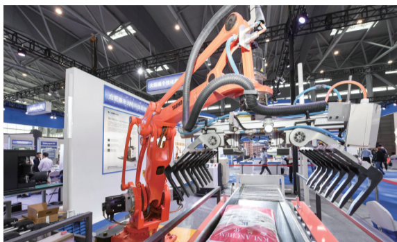
一款码垛机器人亮相