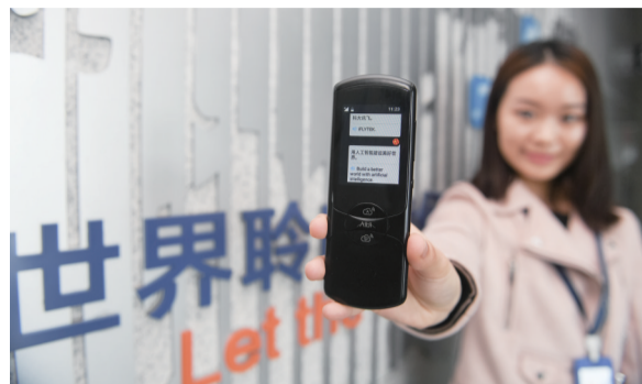
工作人员展示讯飞翻译机2.0研发机型

2018世界制造业大会和2018中国国际徽商大会5月刚刚在安徽合肥顺利举办。安徽，这个曾经的农业大省、劳务输出大省，如今已跨入制造大省的门槛，向着“制造强省”加速跑。而这些成就的取得，与安徽不断改革创新，提高对外开放水平，以开放促改革、促发展有着千丝万缕的联系。