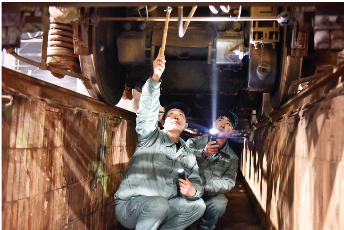
父亲教授儿子检查火车的经验