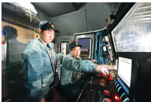
父亲指导儿子开车经验和技巧